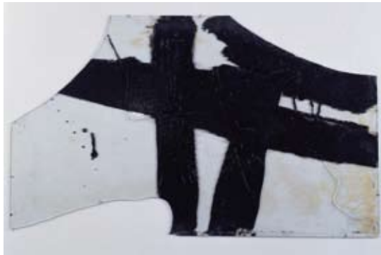
Pierre Soulages Goudron sur verre 45.5 x 76.5 cm, 1948 Collection particulière Archives Pierre Soulages, Paris (photo DR) © Adagp, Paris 2009