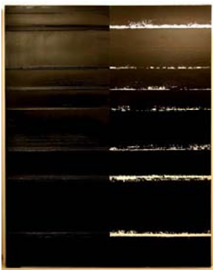
Pierre Soulages, Peinture 300 x 235 cm, 9 juillet 2000, huile sur toile, collection privée Adagp, Paris, 2009

Pierre Soulages est né en 1919 à Rodez en Aveyron. Un musée consacré à son œuvre y ouvrira ses portes en 2012.