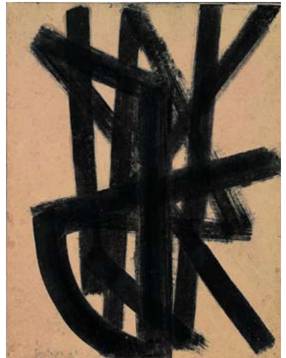
Pierre Soulages Brou de noix 65 x 50 cm, 1948 Collection Centre Pompidou, Musée national d'art moderne, Diffusion RMN © Adagp, Paris 2009